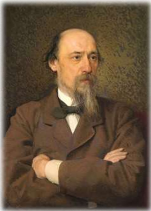
И.И. Крамской Портрет Н.А. Некрасова 1877