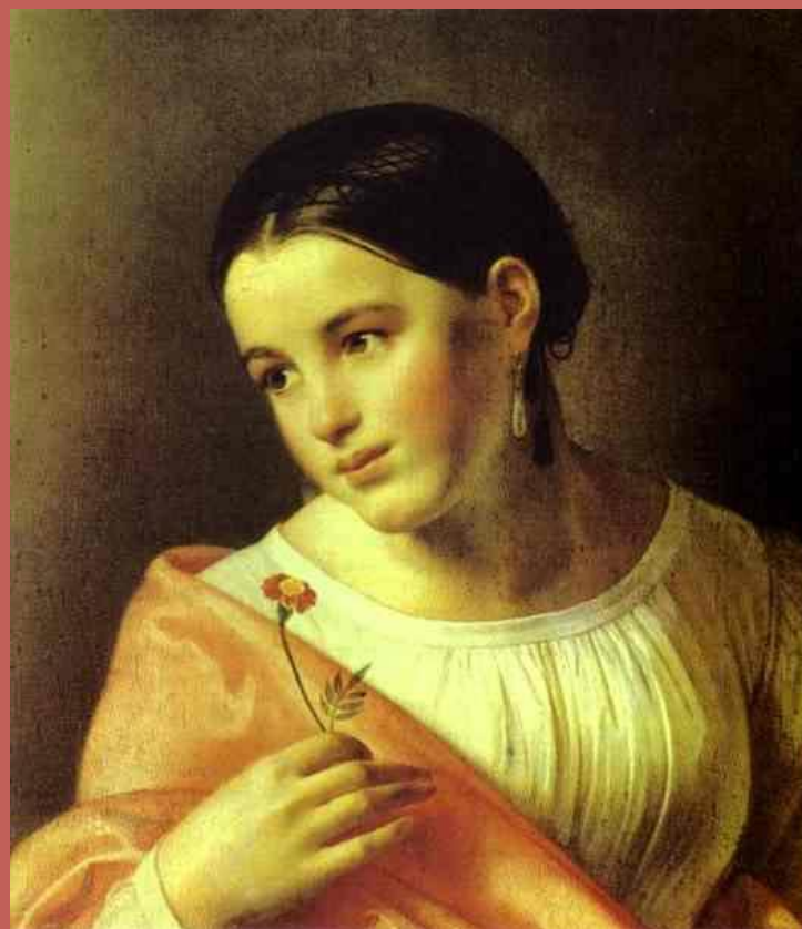
О. А. Кипренский. «Бедная Лиза»