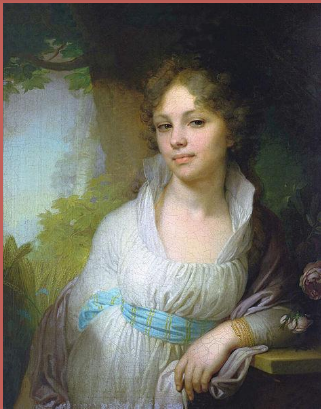
В.Л. Боровиковский. Портрет М. И. Лопухиной, 1797

Она давно прошла, и нет уже тех глаз И той улыбки нет, что молча выражали Страданье — тень любви, и мысли — тень печали, Но красоту её Боровиковский спас. Так часть души ее от нас не улетела, И будет этот взгляд и эта прелесть тела К ней равнодушное потомство привлекать, Уча его любить, страдать, прощать, молчать. Я. П. Полонский