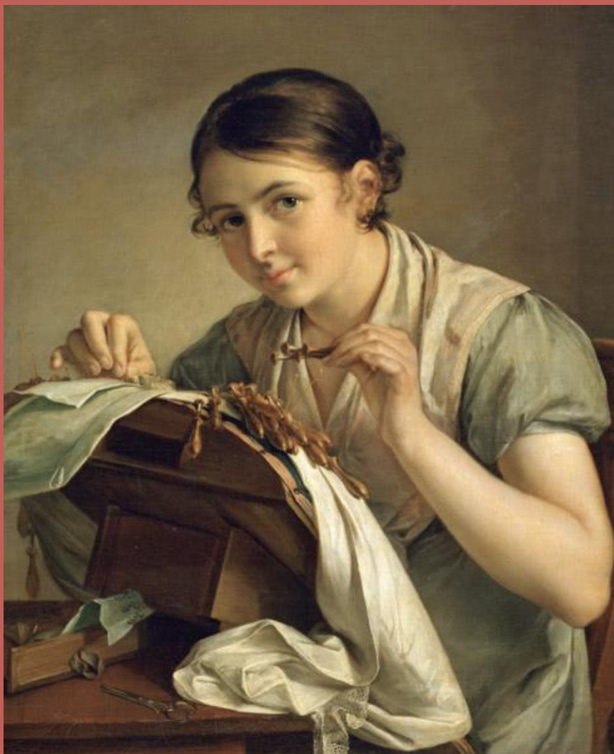
В.А. Тропинин. «Кружевница», 1823