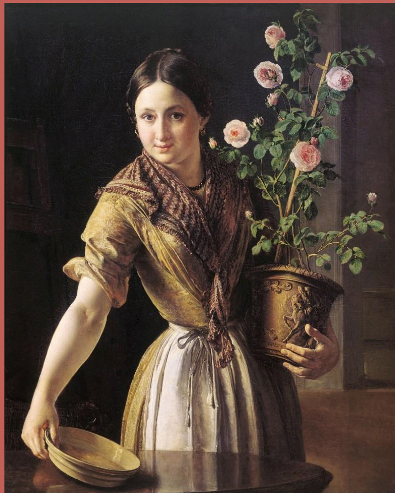
В.А. Тропинин «Девушка с горшком роз»