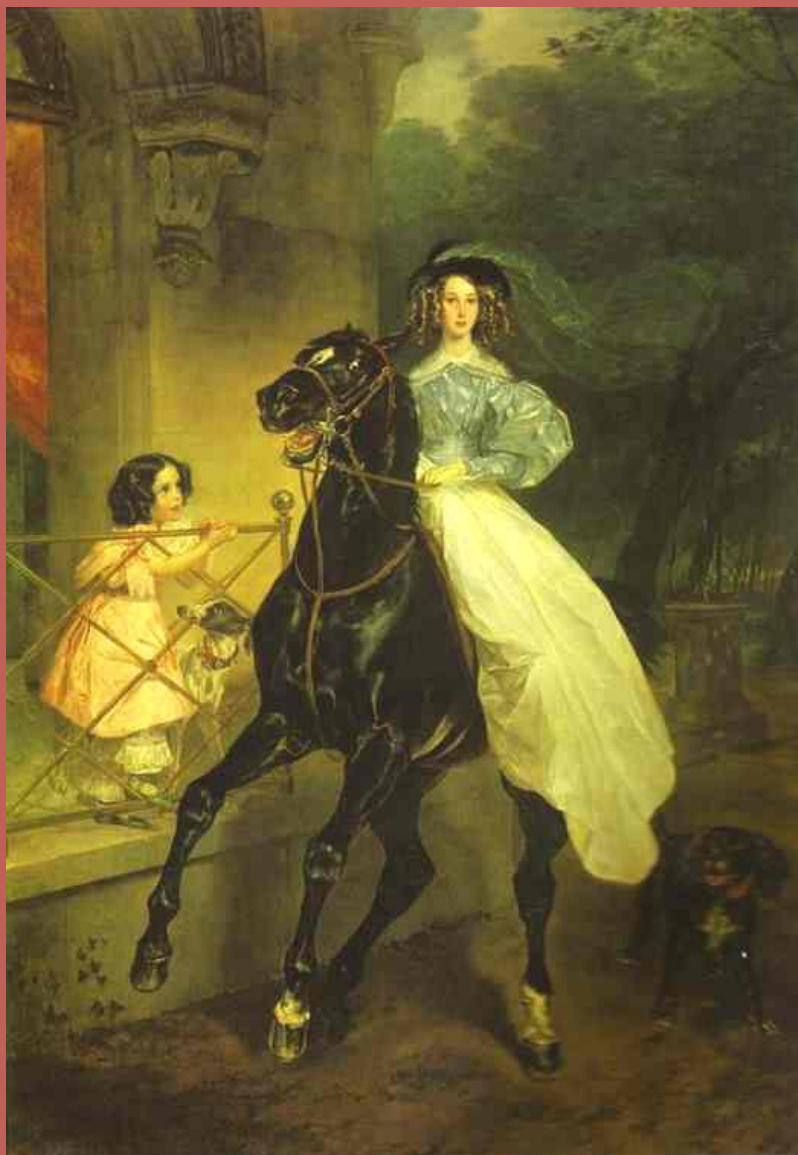
К. П. Брюллов. «Всадница»