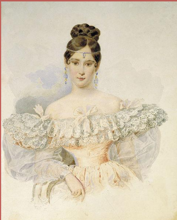
А. П. Брюллов. Портрет Н.Н. Пушкиной. Акварель, 1831—1832

«Гляделась ли ты в зеркало и уверилась ли ты, что с лицом твоим ничего сравнить нельзя на свете, а душу твою люблю я еще более твоего лица!"