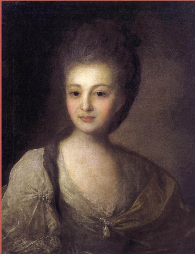
Ф.С. Рокотов. Портрет А. П. Струйской, 1772

Ты помнишь, как из тьмы былого, Едва закутана в атлас, С портрета Рокотова снова Смотрела Струйская на нас?