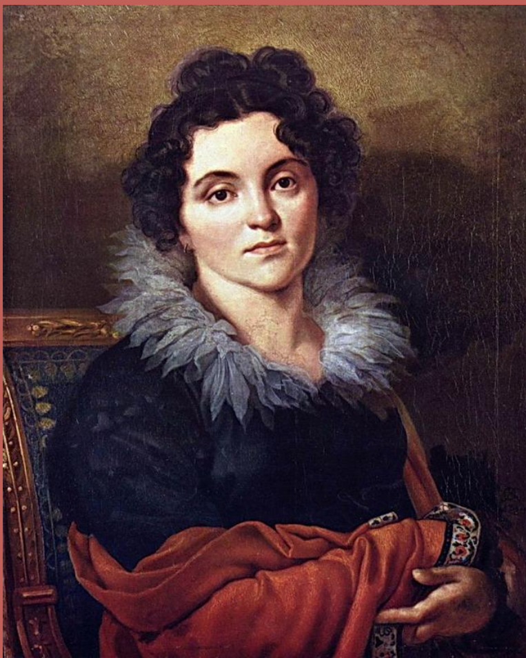
О.А. Кипренский. Портрет Д. Н. Хвостовой, 1827