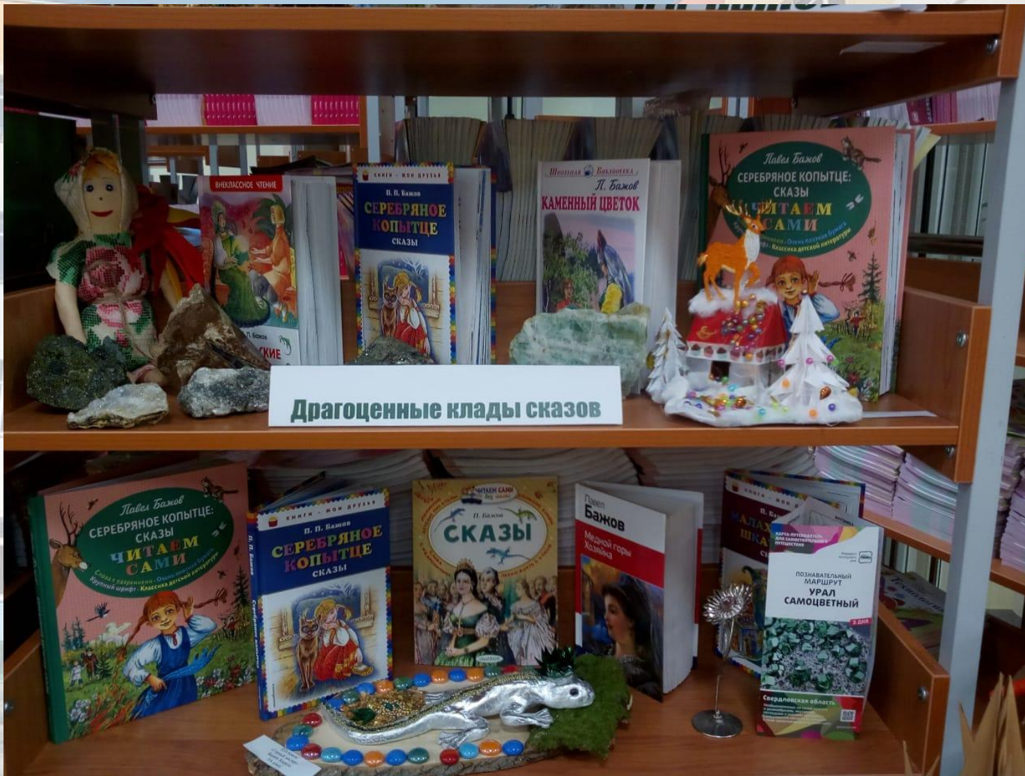
Драгоценные клады сказов