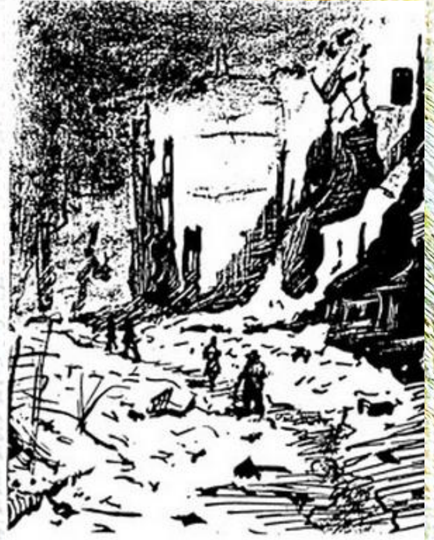
Военные зарисовки художника (1943-1945)