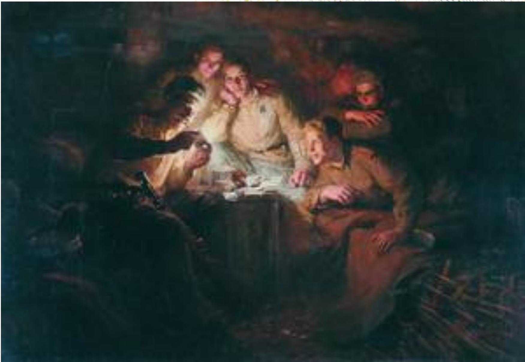
О далеких и близких (1950)