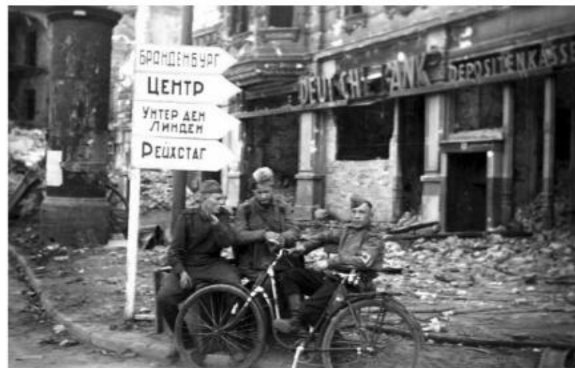
Берлин. Май 1945 года. Я пытаюсь организовать велосипед

В журнале публикуются уникальные фотографии военных лет из личного архива Б.М. Неменского. Подписи сделаны самим художником. ■