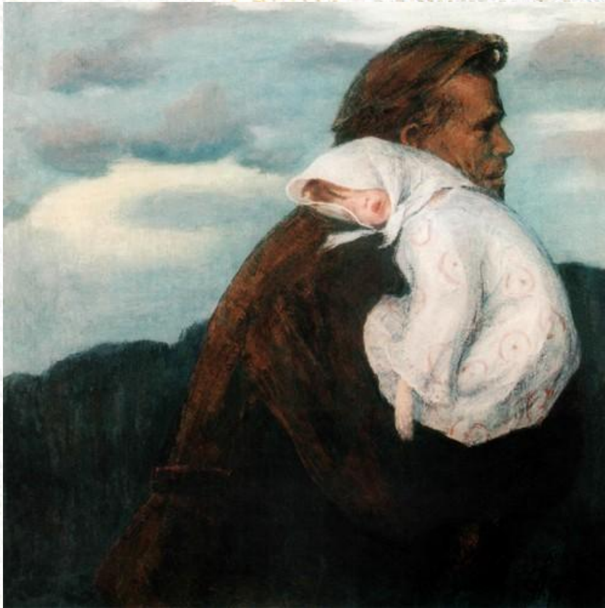
В пути (1970)